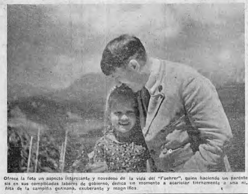
Ofrece la foto un aspecto interesante y novedoso de la vida del "Fuehrer", quien haciendo un paréntesis en sus complicadas labores de gobierno, dedica un momento a acariciar tiernamente a una niñita de la campaña germana, exuberante y magnífica.