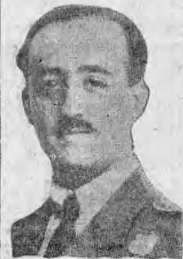
GRAL. FRANCISCO FRANCO.

El nuevo ministro de guerra de España, don José María Gil Robles, trata de llevar a cabo un amplio plan de reorganización de las actividades militares en su país.